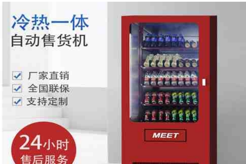
伊维特科技 自动售货机

一场轰轰烈烈的新零售运动全国席卷而来。绍兴中吉无人超市无人业态天天有新招，资历老的无人售货机反而被看好？